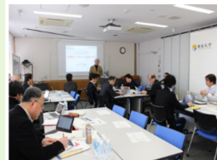
審査結果をワークショップにて議論